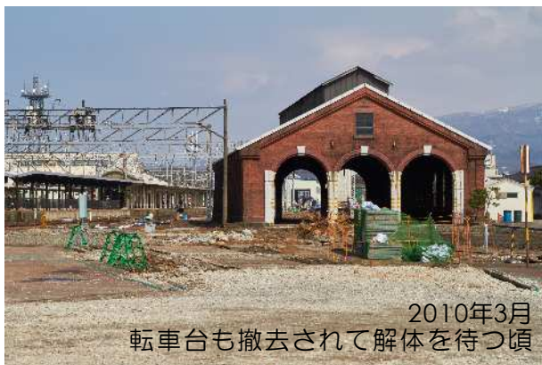
2010年3月 転車台も撤去されて解体を待つ頃