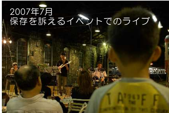
2007年7月 保存を訴えるイベントでのライブ