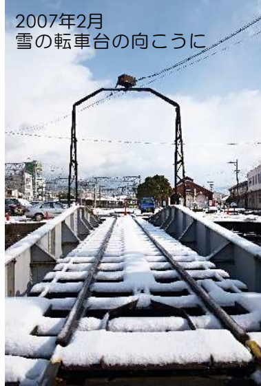
2007年2月 雪の転車台の向こうに