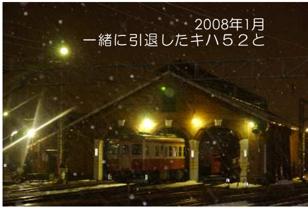
2008年1月 一緒に引退したキハ52と